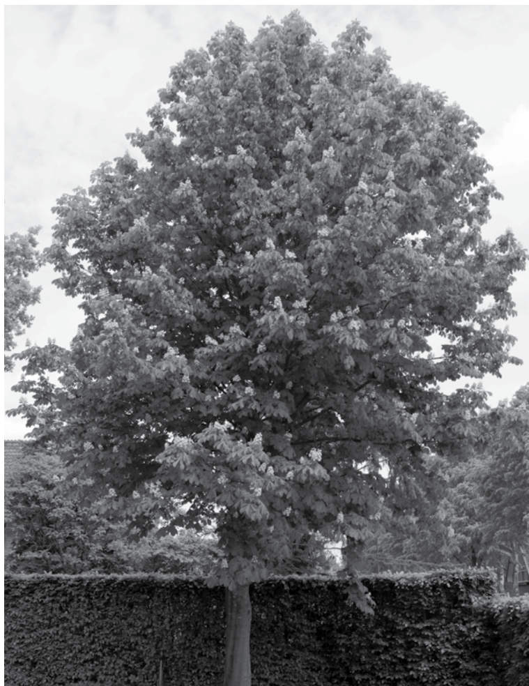
Kastanje aan Ugchelseweg 92.

De werkgroep van de Gemeente Apeldoorn gaat in de maand juni alle vergaarde informatie uitwerken en zal in het najaar een advies aan de Gemeenteraad geven. Het voorgenomen advies zal op voorhand, medio juli, worden teruggekoppeld naar de eerder genoemde vertegenwoordigers, waaronder de dorpsraad Ugchelen.