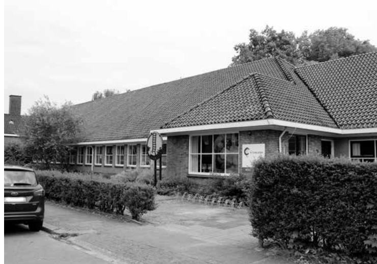
Het huidige schoolgebouw van De Touwladder heeft zijn langste tijd gehad.