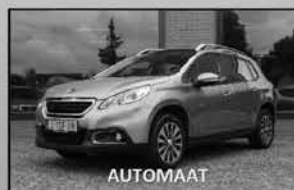
Peugeot 2008 1.2 Active 04-2014, 64.078km Cruise control, parkeersensoren € 11.375,-