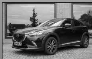
Mazda CX-3 2.0 GT-M 06-2015, 100.600km Navi, trekhaak, stoelverwarming € 16.875,-