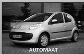
Citroen C1 1.0 Ambiance 03-2009, 60.567km Airconditioning, zeer nette auto € 5.950,-

Uw partner in mobiliteit Keuze uit ruim 60 occasions!