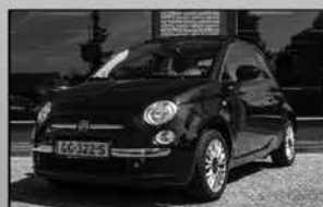
Fiat 500 TwinAirLounge 05-2015, 66.299km Climate control, groot open dak € 9.200,-