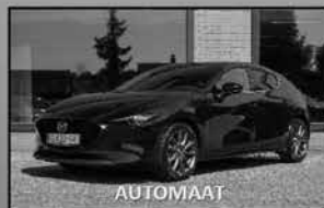
Mazda 3 2.0 Luxury 09-2019, 14.077km Leer, navi, 360 camera, i-Activense € 27.700,-