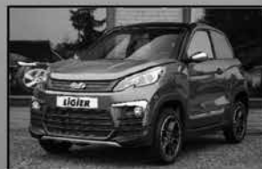
Ligier JS60 Chic Het nieuwe model van Ligier met airco en stuurbevestiging € 17.990,- Geen auto rijbewijs nodig