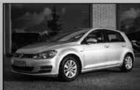
Volkswagen Golf 1.6TDI 05-2014, 207.493km Navigatie, trekhaak, cruise control € 9.950,-