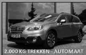
Subaru Outback Premium 01-2017, 97.220km Leer, open dak, navi, trekhaak € 29.500,-