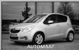
Opel Agila 1.2 Edition 06-2011, 63.504km Airco, cruise control, trekhaak € 8.950,-