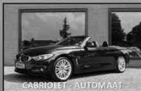
BMW 428i cabriolet 07-2015, 87.041km Leer, navi, stoel+nekverwarming € 32.750,-