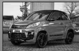
Ligier JS60 Sport Ultimate airconditioning, stoelverwarming en stuurbekrachtiging € 19.250,-

Uw auto- en brommobiel- dealer voor Apeldoorn en de Veluwe