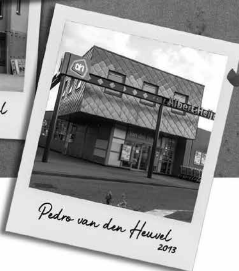
Pedro van den Heuvel 2013