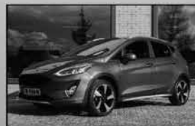
Ford Fiesta Active 09-2018, 37.221km Navi, hoge zit, park. sensoren € 16.250,-