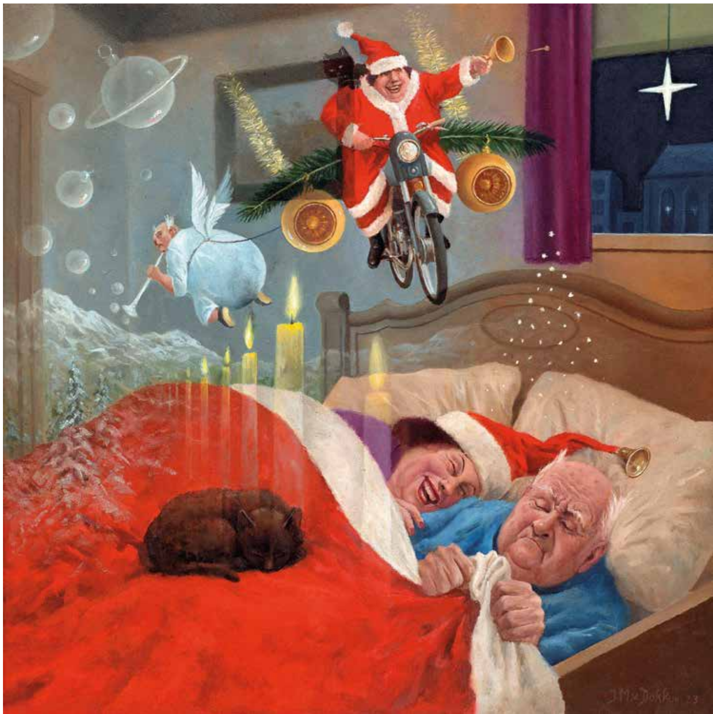
'Kerstdroom' (olieverf op doek), Marius van Dokkum