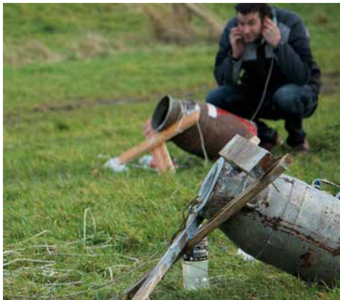
Traditioneel schieten met een melkbus is genomineerd op de lijst van Immaterieel Cultureel Erfgoed

gen als ze op weg zijn om paarden te beslaan.